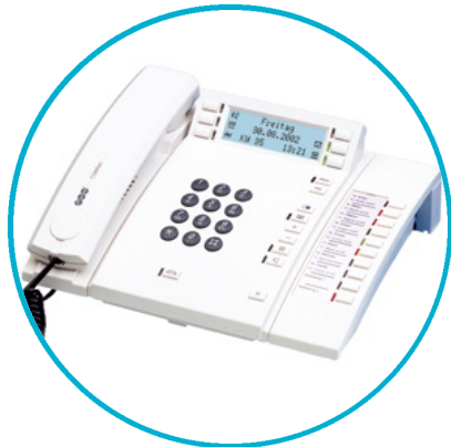
COMfort 2000 plus

EHS bedeutet elektronische Gesprächsannahme und -beendigung.