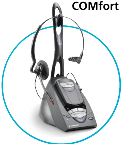
CA40 (DECT Headsets) CS60

Schiebeschalter CS60 Rückseite auf 3 stellen