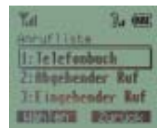
Telefonbuch, Wahlwiederholungsliste und Anruferliste