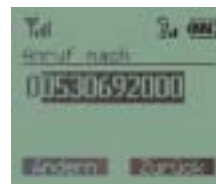
Fuzzy-Wahl: automatische Vervollständigung der zuletzt gewählten Rufnummern