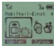
Menüpunktswahl über Icons